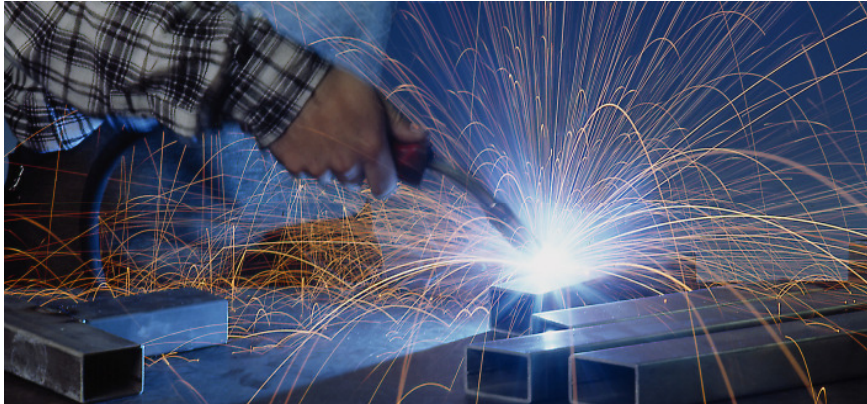
Nach DIN 287 geprüfte Schweißer

Ein durchgängiges Qualitätsmanagement überwacht unsere gesamte Fertigung. Vom Handschweißen oder Polieren bis hin zum CNC gesteuerten Sägen, Biegen, Kanten, Runden und Fräsen – unser Fachpersonal ist gut vorbereitet: Langjährige Erfahrung in allen gängigen Verfahrenstechniken sowie ein vielseitiger Maschinen- und Gerätepark garantieren erstklassige Verarbeitungsqualität und Bauteile höchster Güte.