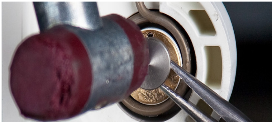
Endmontage einer Baugruppe

Auf die vielfältigen Anforderungen der Kunden hat die Lehnen GmbH mit einem erweiterten Leistungsangebot reagiert: Unsere konfektionierte Serienfertigung reicht von der reinen Fertigung der Rohteile über die Bearbeitung der Oberfläche bis hin zur Endmontage mit dem Einbau verschiedenster Komponenten. All dies wickeln wir komplett im Haus ab. Geschulte Hände machen aus der Summe der Einzelteile Ihr Produkt. Im Anschluss an die Endmontage folgen je nach Kundenwunsch Reinigung, Verpackung und Versand „Just-in-Time“.