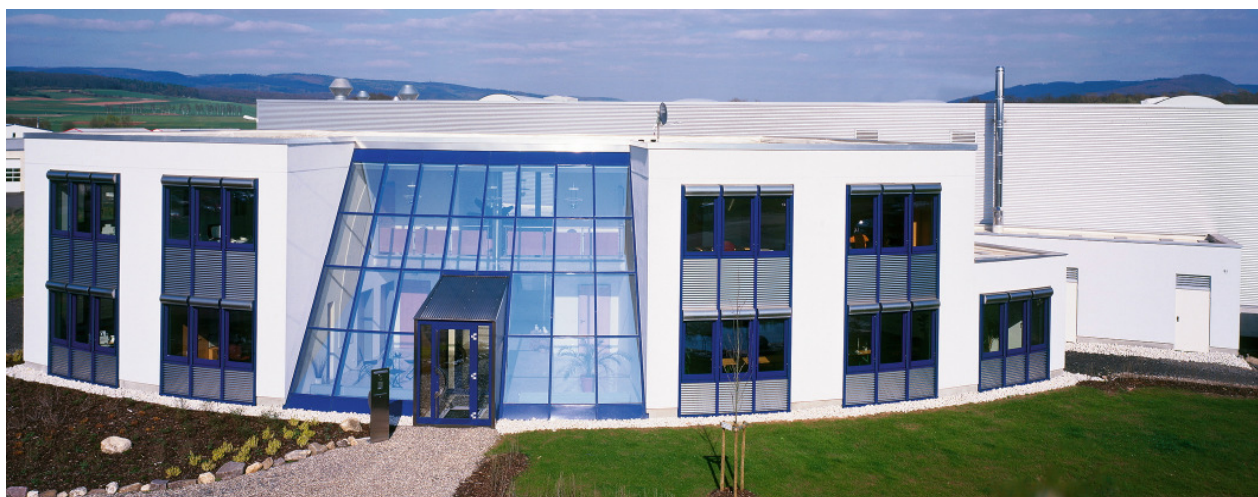
Der neue Firmensitz in Wittlich

Kompetenz kann man sich nur erarbeiten. Seit fast 50 Jahren stellt unser Unternehmen hochwertige Aluminium-, Edelstahl- und Stahlbauteile her: Prototypen, Serienprodukte und Baugruppen. Unsere Kunden legen Wert auf perfekte Verarbeitung, intelligenten Service und absolute Liefertreue.